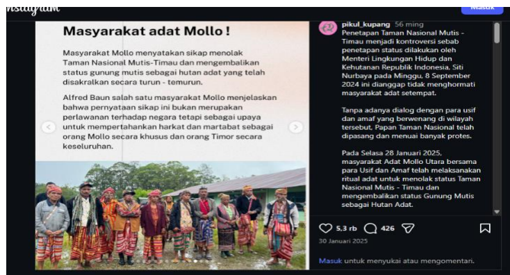
Gambar 7. Deklarasi perlawanan masyarakat mutis timau

Pernyataan tegas bahwa “Mutis ditutup untuk publik!” pada Gambar 6 menunjukkan adanya klaim kedaulatan tandingan. Pilihan kata ‘ditutup’ menunjukkan adanya tindakan pembatasan akses terhadap wilayah Mutis yang sebelumnya dipahami sebagai ruang terbuka bagi publik dalam kerangka taman nasional. Frasa untuk publik juga menegaskan bahwa wilayah Mutis tidak diposisikan sebagai ruang wisata atau objek eksplorasi umum, melainkan sebagai wilayah yang memiliki batas-batas sosial dan kultural yang ditentukan oleh masyarakat adat. Melalui teks ini, masyarakat membalikkan relasi kekuasaan bahwa jika negara mampu membatasi akses melalui regulasi Taman Nasional, maka masyarakat memiliki otoritas tradisional untuk membatasi ruang publik seperti yang dilakukan oleh negara dengan dalil hukum adat.