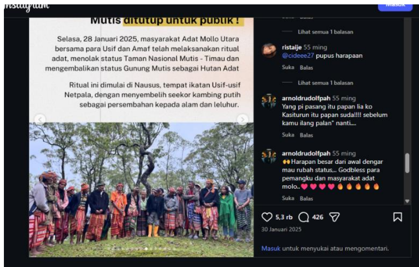
Gambar 6. Mutis ditutup untuk publik

tersebut. Teks tersebut juga menampilkan kritik terhadap proses penetapan kebijakan melalui kalimat “ penetapan ini tidak ada dialog dengan para usif. ” Penyebutan kata usif , yang merujuk pada pemimpin adat dalam struktur sosial masyarakat Mollo, menegaskan bahwa keputusan mengenai wilayah Mutis seharusnya melibatkan otoritas adat yang memiliki legitimasi dalam komunitas tersebut. Melalui teks ini, perlawanan masyarakat adat berhasil menunjukkan kecacatan negara dalam prosedur pengelolaan kawasan hutan dari aspek kultural.