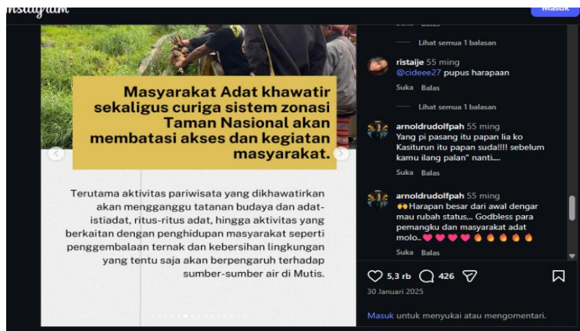
Gambar 3. Kecurigaan Masyarakat terhadap Taman Nasional Sumber. Instagram yayasan @pikul dan @wahli.ntt

“Ancaman di Balik Ritual Adat ‘Fanu’ sebagai Perlawanan Masyarakat Adat atas Taman Nasional Mutis Timau” menunjukkan penggunaan kosakata yang menegaskan adanya konflik antara masyarakat adat dan kebijakan negara. Kata “ancaman” membangun representasi situasi yang penuh ketegangan, sementara istilah “ritual adat” digunakan sebagai senjata perlawanan dalam praktik budaya. Selain itu, penggunaan frasa “perlawanan masyarakat adat” memperlihatkan bahwa ritual tidak hanya dipahami sebagai aktivitas spiritual, tetapi juga sebagai bentuk ekspresi politik masyarakat adat dalam mempertahankan ruang hidup mereka. Melalui pembingkai digital, ritual “Fanu” merupakan perlawanan kolektif yang dapat membangun solidaritas publik guna mengantisipasi konsekuensi buruk dari penetapan status kawasan tersebut.