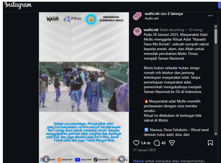
Gambar 4. Mutis Timau rumah Roh Leluhur

Pada Gambar 4, diksi seperti “rumah roh leluhur”, “jantung kehidupan masyarakat adat”, serta “sumpah sakral kepada arwah dan alam” berfungsi memperkuat legitimasi kosmologis masyarakat adat terhadap wilayah tersebut. Selain itu, struktur kalimat yang menekankan frasa “tanpa persetujuan masyarakat adat” secara kritis membongkar hegemoni negara. Strategi bahasa ini membingkai kebijakan negara dalam penetapan taman nasional sebagai tindakan sepihak, sehingga berhasil menciptakan oposisi melalui perlawanan di ruang publik antara otoritas negara dan kedaulatan moral masyarakat adat.