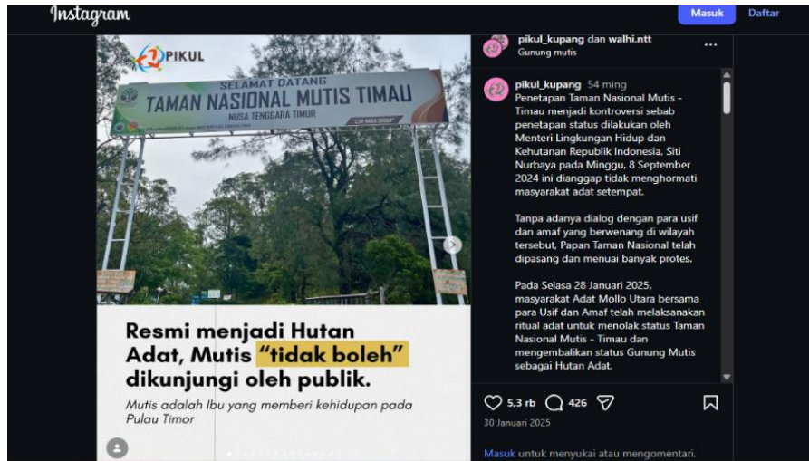
Gambar 1. Gapura Taman Nasional dan Deklarasi Hutan Adat

Unggahan Instagram pada Gambar 1 menunjukkan adanya wacana perlawanan dalam memperebutkan hak atas ruang. Di bagian atas gambar terdapat papan bertuliskan “Selamat Datang di Taman Nasional Mutis Timau” yang merepresentasikan otoritas negara dalam mendefinisikan status kawasan tersebut sebagai bentuk hegemoni ruang secara legal dan formal. Namun, teks tandingan muncul pada bagian bawah gambar yang menyatakan bahwa Mutis “resmi menjadi hutan adat” dan “ tidak boleh dikunjungi oleh publik ”. Pilihan kata “resmi” dan frasa larangan “tidak boleh” menunjukkan emansipasi masyarakat adat untuk membangun legitimasi alternatif terhadap pengelolaan wilayah Mutis. Selain itu, penggunaan metafora “Mutis adalah ibu yang memberi kehidupan pada Pulau Timor” memperlihatkan bagaimana masyarakat adat memaknai alam sebagai entitas yang memiliki relasi spiritual dan kultural dengan kehidupan mereka. Tindakan ini menunjukkan kedaulatan masyarakat adat yang tidak dapat tunduk pada aturan formal karena mereka memahami dengan baik kosmologi ruang yang sedang mereka huni.