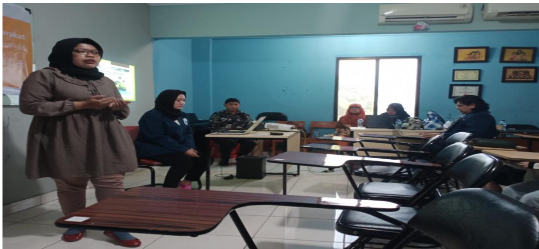
Gambar 6. Pemateri Sedang Membangun Interaktif Ke Siswa-Siswi Tanda Genap