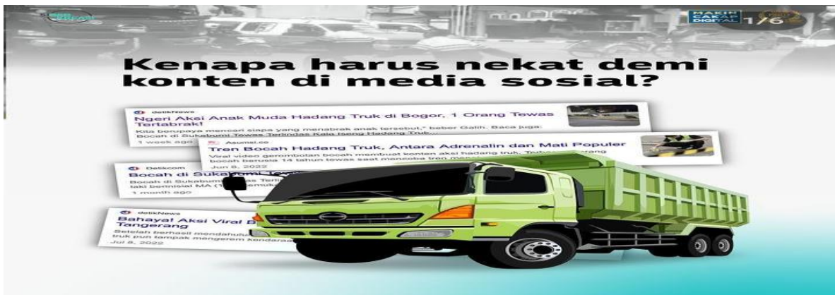
Gambar 4 Konten Viral di Media Sosial

Selain itu, sekarang ini banyak sekali konten yang membuat kegaduhan demi ingin ditingkatkan populeritas pengguna media sosial. Adapun konten yang ditonjolkan dapat berakibat fatal bagi mereka. Adapun contoh konten viral yang ditonjolkan di dalam media sosial antara lain: