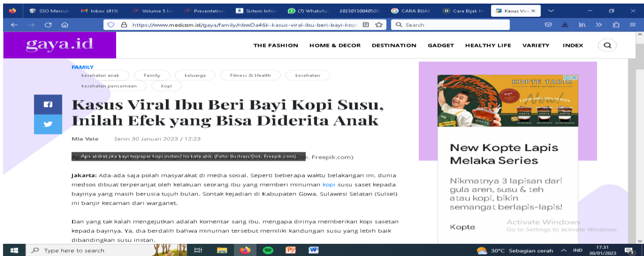
Gambar 3 Kasus Viral Akibat Kejahatan Internet

Komposisi Pengguna Berdasarkan gender ialah 47,5% Perempuan dan 52,5% Laki Laki. Dimana penulis juga menjelaskan maraknya kasus kejahatan di dalam internet atau media sosial. Terlihat pada gambar di bawah ini :