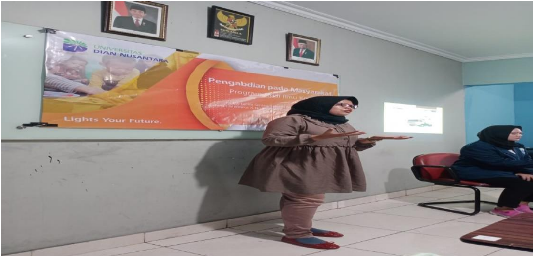
Gambar 5. Pemateri Sedang Memaparkan Penjelasan Kepeserta Pengabdian Kepada Masyarakat

berkomunikasi, Isi konten dari sumber terpercaya dan valid, menggunakan bahasa yang baik dan benar, Jangan membuat konten SARA, Pornografi, dan Kekerasan, Mengontrol Jumlah Unggahan, Hati-hati dalam membagikan informasi, Pentingnya Consent (persetujuan) ketika mengunggah konten. Berikut ialah pemateri dalam memaparkan penjelasan di dalam Kegiatan Pengabdian Kepada Masyarakat.