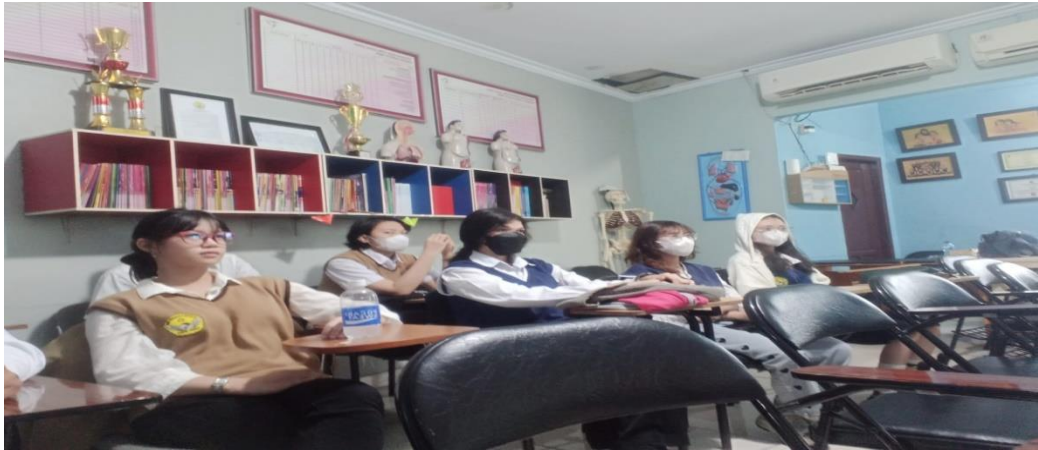
Gambar 7. Peserta Kegiatan Pengabdian Kepada Masyarakat