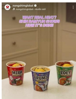
Gambar 3. Produk kolaborasi film K-pop Demon Hunters dengan brand Nongshim

Selain melalui penjualan merchandise resmi, sales promotion dalam promosi K-pop Demon Hunters juga terlihat pada kolaborasi produk dengan brand ramen asal Korea Selatan, yaitu Nongshim.