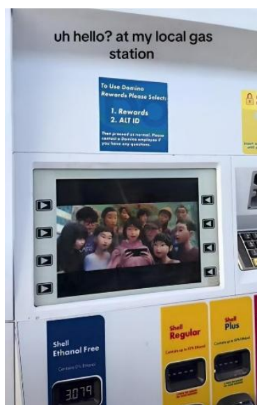
Gambar 1. Iklan Trailer K-pop Demon Hunters di Pom Bensin

Selain memanfaatkan lokasi ikonik berskala global, promosi film K-pop Demon Hunters juga dilakukan melalui penayangan iklan trailer pada layar digital di area pom bensin seperti pada jaringan Shell di Oklahoma dan Exxon di Duncannon, Amerika Serikat.