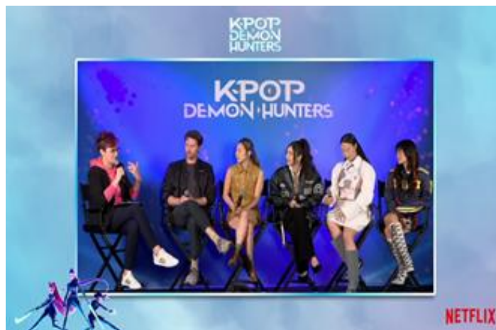
Gambar 4. Wawancara bersama kreator dan pengisi suara Huntr/x film K-pop Demon Hunters

promosi utama seperti poster atau trailer. Audiens tidak hanya menerima informasi mengenai film, tetapi juga mendapatkan pemahaman yang lebih luas mengenai latar belakang kreatif, konsep cerita, serta proses kolaborasi antara para kreator dan pengisi suara.