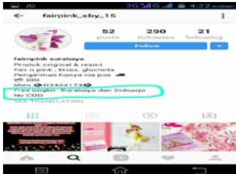
Gambar 5. Profil fairpink_sby_15

Pink. Strategi free ongkos kirim memang sudah banyak di lakukan para pengusaha online seperti halnya pada akun@fairpink_sby_15 pada gambar di bawah ini: