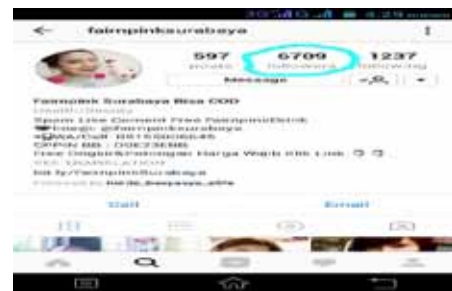
Gambar 1. Jumlah Followers (12 Juli 2017)

Dalam Instagram terdapat fitur-fitur yang bisa dimanfaatkan oleh setiap penggunanya. Adapun fitur-fitur yang membantu dalam pemasaran atau promosi barang dan jasa yang di jual secara online . Begitu juga yang di lakukan oleh Fair N Pink Surabaya ini, ada beberapa fitur yang di gunakan oleh Fair N Pink Surabaya sebagai media promosinya melalui Instagram. Strategi akan dikaitkan dengan fitur yang di manfaatkan oleh Fair N Pink Surabaya. Berikut fitur dalam akun Instagram Fair N Pink Surabaya yang telah di manfaatkan sebagai sarana strategi pemasaran online , yaitu: