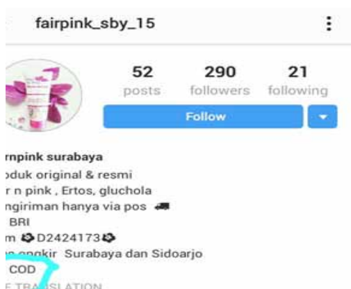
Gambar 3. Profil fairpink_sby_15

Dalam hal pengiriman akun@Fair N Pink Surabaya memberlakukan free ongkos kirim, strategi promo gratis ongkos kirim ini mampu mendapatkan pelanggan yang loyal, karena siapapun pasti tertarik dengan penawaran produk yang menggeratiskan ongkos kirim. Pembeli merasa diuntungkan karena ongkos kirim yang seharusnya di tanggung pembeli menjadi hilang. Dalam hal ongkos kirim Fair N Pink Surabaya tidak membatasi wilayah tetapi memberikan subsidi ongkos kirim sebesar Rp. 20.000 jadi kalau ongkos kirimnya di bawah Rp. 20.000 biaya pengiriman gratis dan konsumen akan mendapatkan potongan harga jika membeli lebih dari tiga produk Fair N