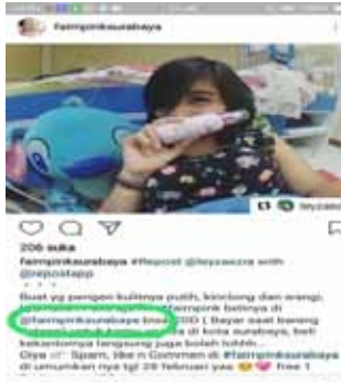
Gambar 10. Tanda arroba (@) pada postingan foto

yang sering meng- upload foto mereka setelah membeli Fair N Pink kemudian di- upload pada akun Instagram mereka dan member tanda arroba (@) pada judul fotonya, seperti pada gambar di bawah ini: