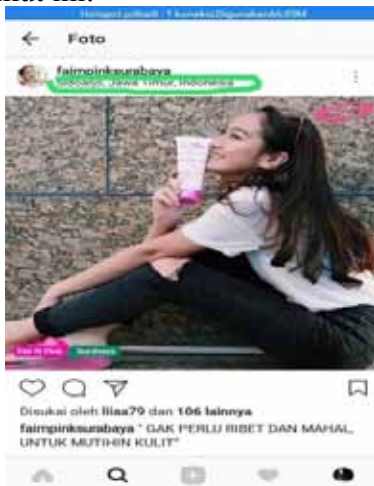
Gambar 11. Geotagging

Setelah memasukan judul foto tersebut, bagian selanjutnya adalah bagian geotagging . Bagian dimana seseorang ingin berbagi dengan orang lain untuk informasi produk ataupun lokasi-lokasi wisata atau kuliner. Seperti yang terlihat pada gambar berikut ini: