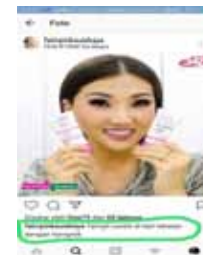
Gambar 9. Judul Foto

Judul foto atau caption merupakan keterangan yang biasanya berisi informasi mengenai foto yang di upload dalam Instagram. Fitur ini di dimanfaatkan oleh Fair N Pink Surabaya untuk member nama pada setiap produk. Judul foto sangat penting agar konsumen mengetahui informasi produk yang di tawarkan oleh sebuah online shop, seperti pada gambar berikut: