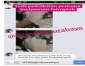
Gambar 8. Stories Fair N Pink Surabaya

Seperti yang terlihat pada gambar 8. Fair N Pink Surabaya mempromosikan produknya menggunakan Stories yang di edit sedemikian rupa untuk menarik perhatian konsumen.