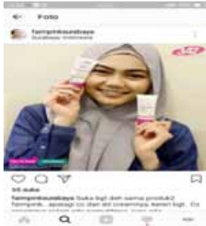
Gambar 7. Gambar endorse Fair N Pink Surabaya

Dari gambar 7. dapat kita ketahui, bahwa Fair N Pink Surabaya dalam mempromosikan produknya melakukan iklan endorser , yaitu menggunakan artis sebagai pendukung promosinya dalam hal menarik minat dan kepercayaan konsumen.