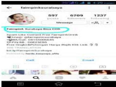
Gambar 2. Profil Fair N Pink Surabaya

kepercayaan dari masyarakat terhadap produknya. Dalam hal menarik perhatian konsumen Fair N Pink Surabaya mempunyai strategi sendiri yang dapat membantu dalam promosinya, strategi tersebut salah satunya dapat kita lihat pada gambar di bawah ini.