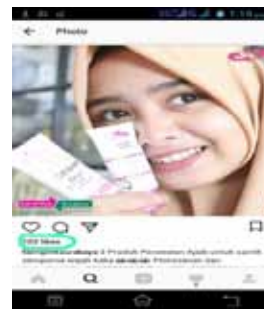
Gambar 13. Tanda suka

Dalam hal ini, peneliti melihat kesempatan pemilik usaha untuk mengaitkan konsumen dari akun media sosial lain selain Instagram ini, berkaitan juga dengan salah satu sifat media bahwa media social dapat menjaukau target auddiencesi di seluruh dunia